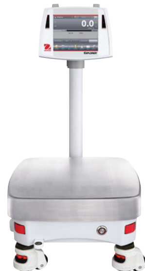
Na zdjęciu z opcjonalnym statywem i obrotowymi nóżkami