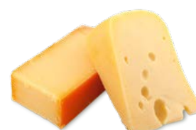
Oznaczanie pH w serach twardej kategory