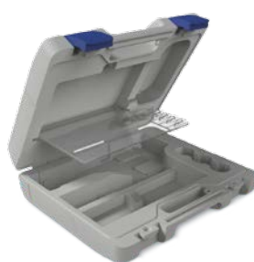
Futerał transportowy uGo™